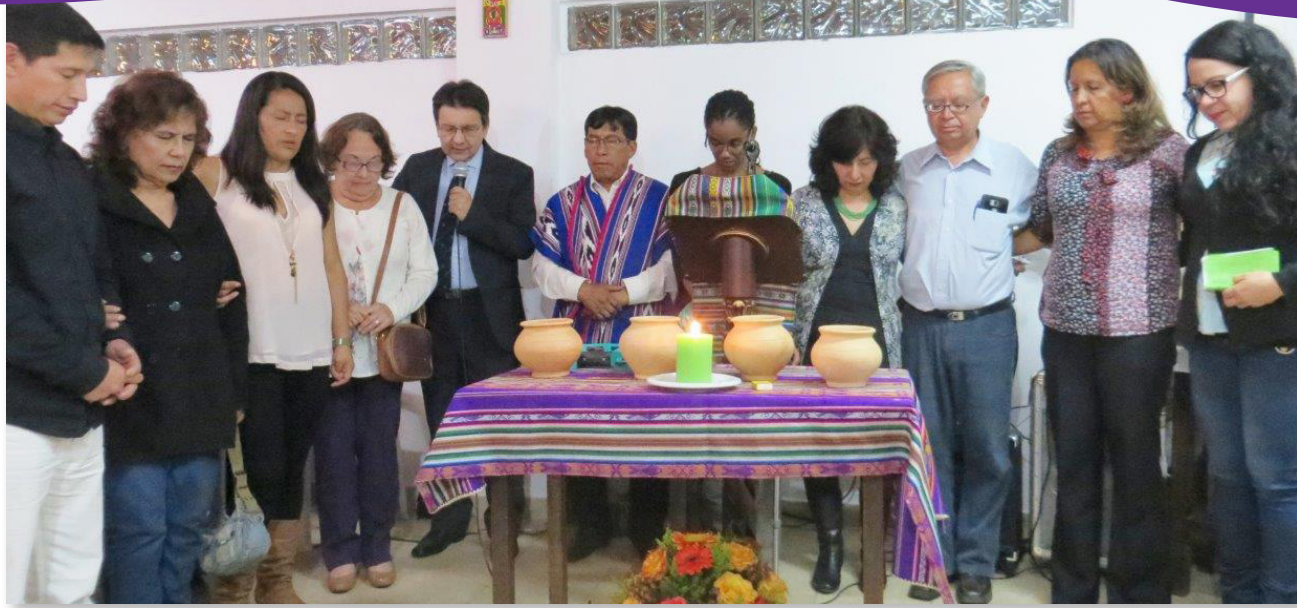
La Iglesia Menonita de Quito dedica su edificio nuevo.