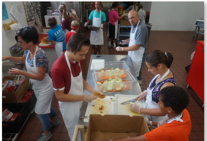
Arriba: Miembros de la iglesia menonita Shalom en un retiro. Abajo: Miembros y jóvenes de Shalom y Salem-Zion preparan alimentos que se servirán en La Mesa Comunitaria, en Eau Claire.