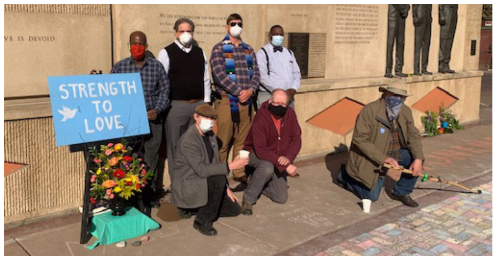
Grupo de hombres “Strength to Love” en el Duluth Clayton-Jackson-McGhie Lynching Memorial, junio, 2020.